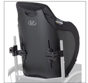
VL ICON-Back Deep