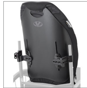
VL ICON-Back Tall