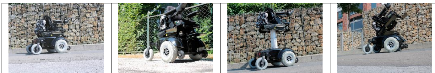
Abgebildetes Model: TA Indoor Wave

Sitz- und Rückeneinheit. Elektr. Sitzlift. R-NET-Elektronik. Inkl. Batterie und Batterieladegerät. 6 km/h-Version.